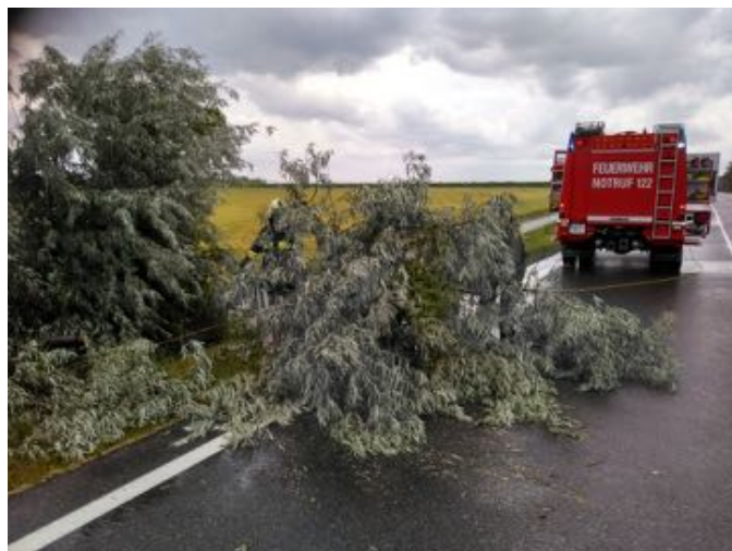
Unwettereinsatz am 22.06.2019 auf der B7