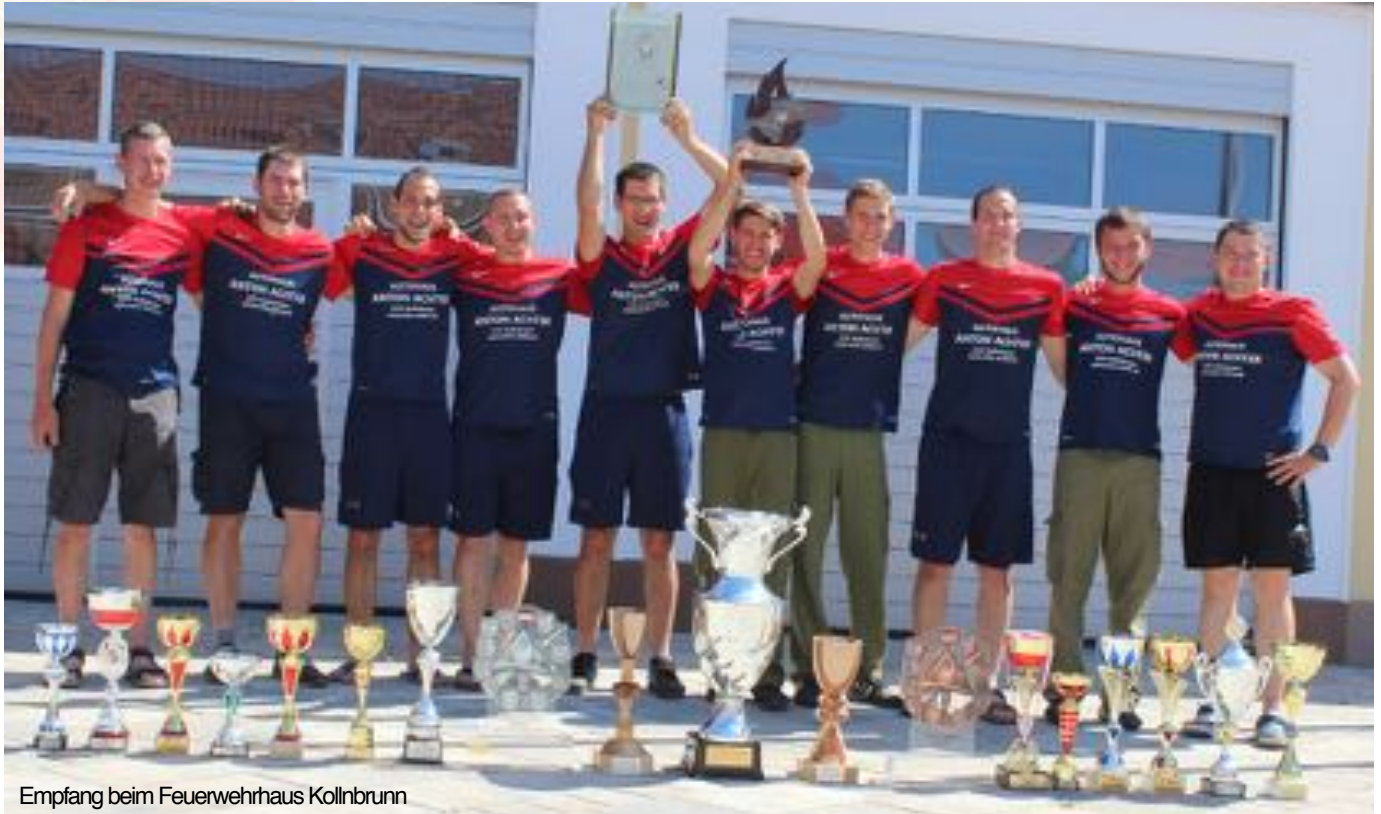
Empfang beim Feuerwehrhaus Kollnbrunn

Mit diesem Rückenwind gingen wir in die heurigen Landesfeuerwehrleistungsbewerbe in Traisen. Konzentriert und fokussiert konnten wir einen perfekten Lauf abliefern und uns mit sensationellen 30,85 Sekunden den dritten Platz unter 650 teilnehmenden Gruppen sichern. Ein Erfolg der so manche emotionalen Dämme brechen ließ und uns noch sehr lange in Erinnerung bleiben wird.