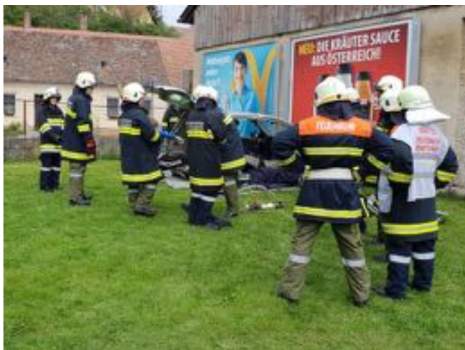
Übung - Menschenrettung mit hydraulischem Rettungsgerät