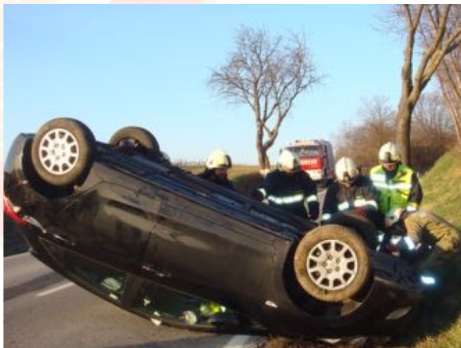
Fahrzeugbergung am 21.03.2019