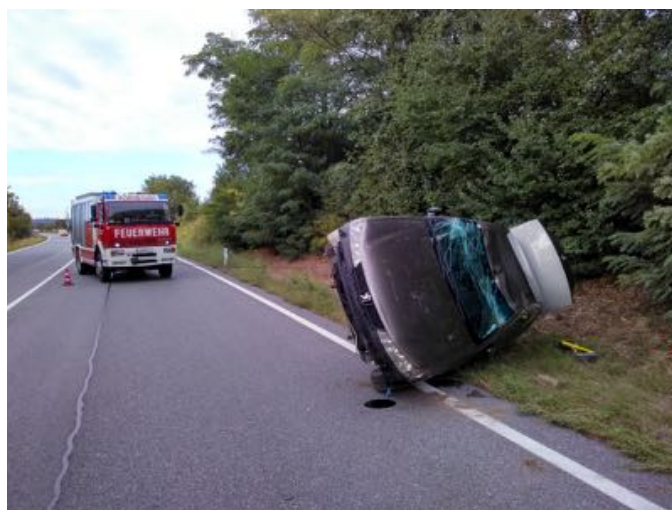
Fahrzeugbergung am 13.09.2019