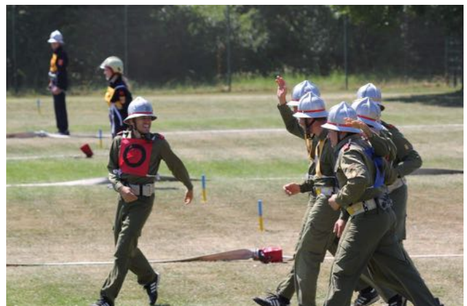
Große Freude nach dem Bewerb in Traisen