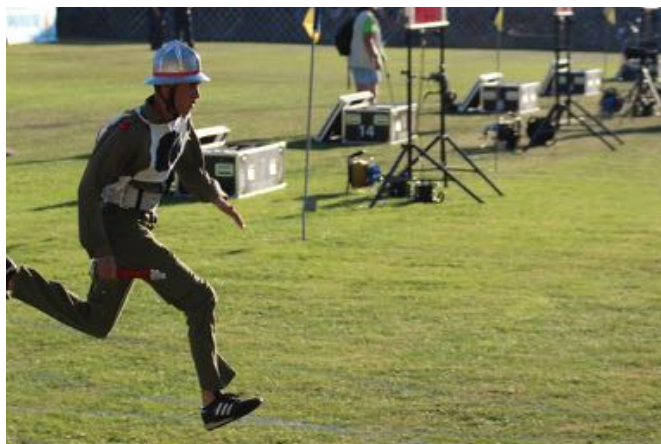
Staffellauf beim Firecup

Ab Jänner begannen wir zwei Mal pro Woche zu trainieren – mit speziellem Fokus auf den Ausbau der mentalen Stärke und der Konzentrationsfähigkeit. Auch hier galt es die letzten Prozent aus der Mannschaft herauszuholen. In diesem Sport ist es notwendig in den entscheidenden Momenten, unter Druck, voll fokussiert und konzentriert die Leistung zu erbringen. In den letzten Saisonen gelang uns das außerordentlich gut – es sollte sich auch heuer wieder als Schlüssel zum Erfolg herausstellen.