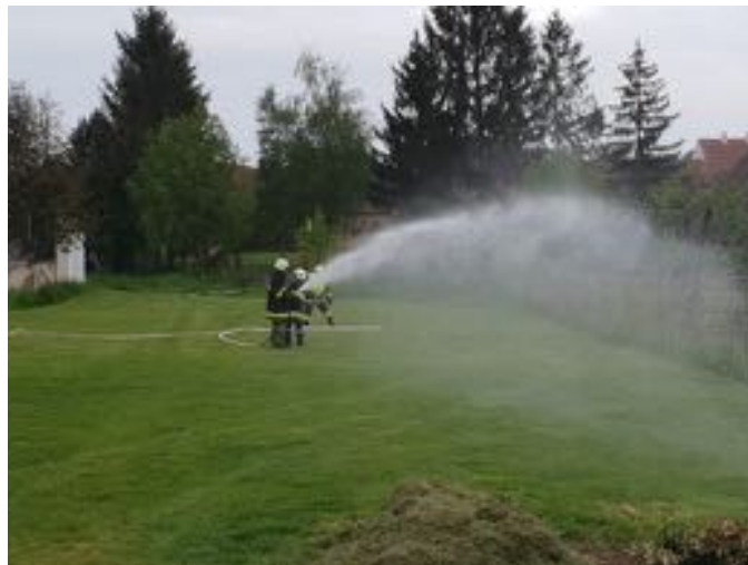
Florianiübung gemeinsam mit der FF Bad Pirawarth