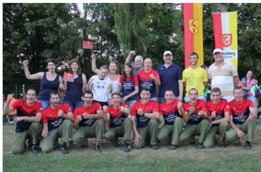
Die erfolgreichen Wettkämpfer mit ihren Fans

Knackpunkt der gesamten Saison war dann eine Woche später der Abschnittsfeuerwehrleistungsbewerb in Gösting. Für die vier Tagesschnellsten des gesamten Bewerbs in Bronze gab es heuer zum ersten Mal einen eigenen KO-Bewerb am Ende der Wettkämpfe. Wir konnten uns im Halbfinale gegen Palterndorf und im Finale gegen Dobermannsdorf mit sensationellen 30,66 Sekunden durchsetzen.